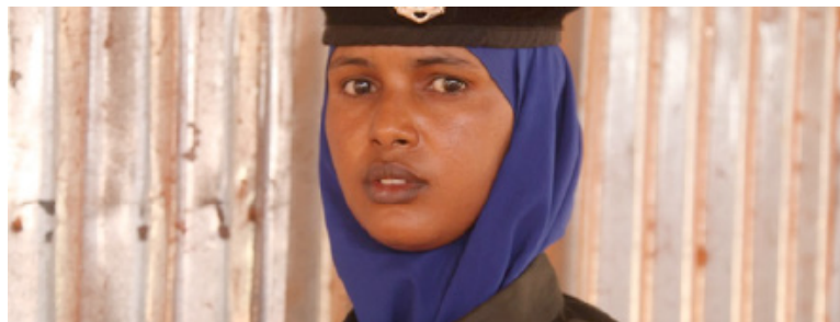
Ett annat hopp är att det blir flera kvinnliga poliser i Somalia